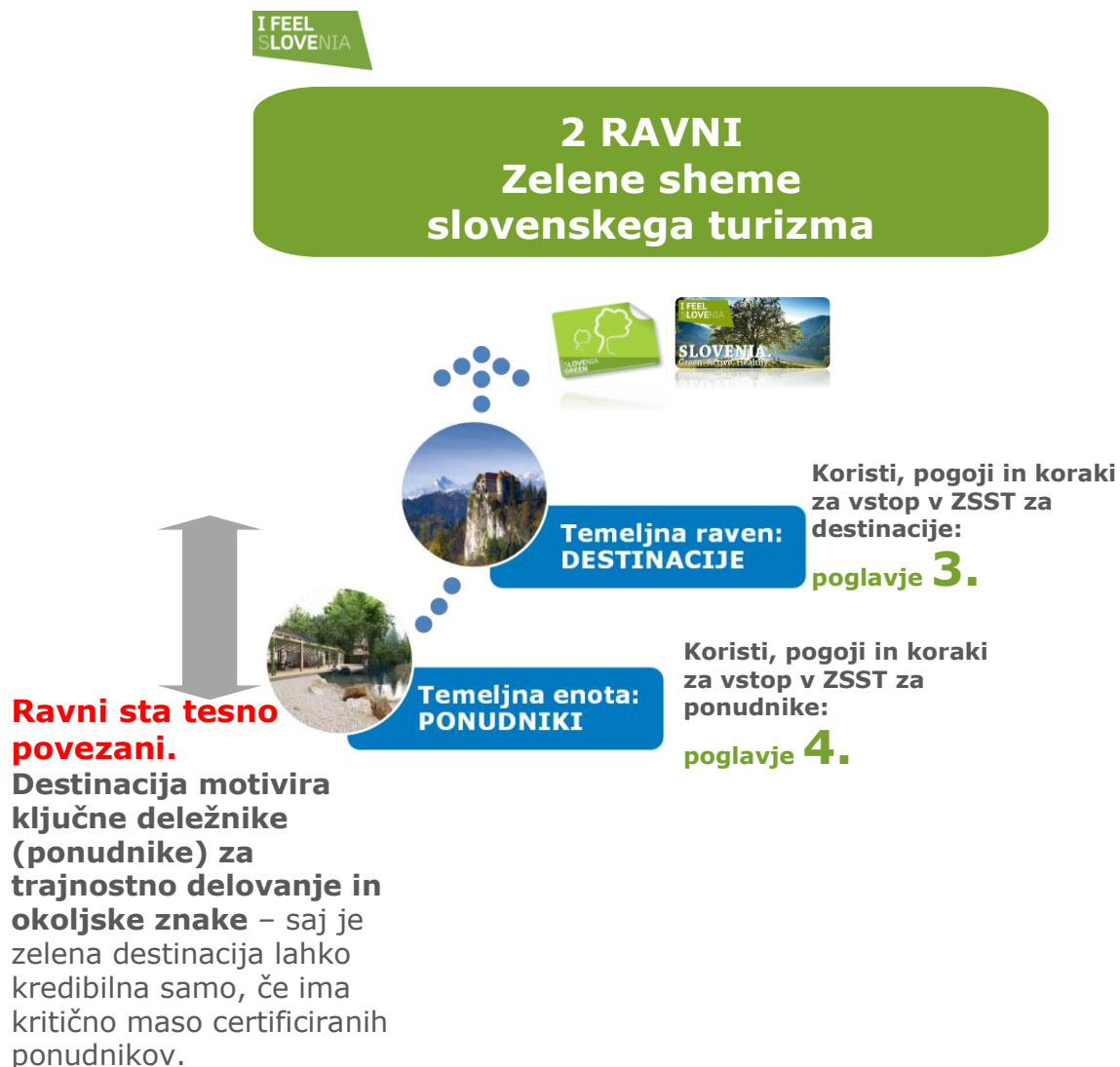
Shema št. 1: Prikaz dveh ravni delovanja ZSST